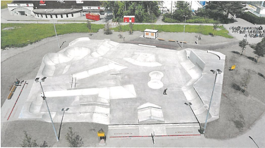
Lo Skate Park di Coira