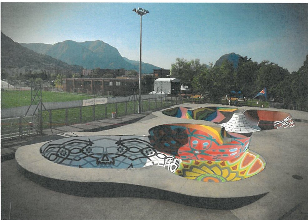
Le Bowl di Lugano