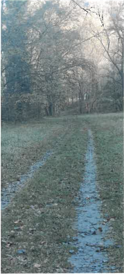
La stradina dalla parte di Bellinzona