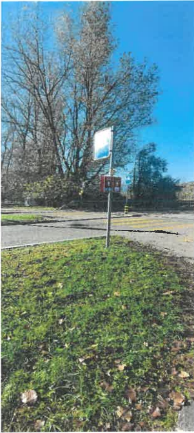
Il passaggio sul ponte di Gorduno