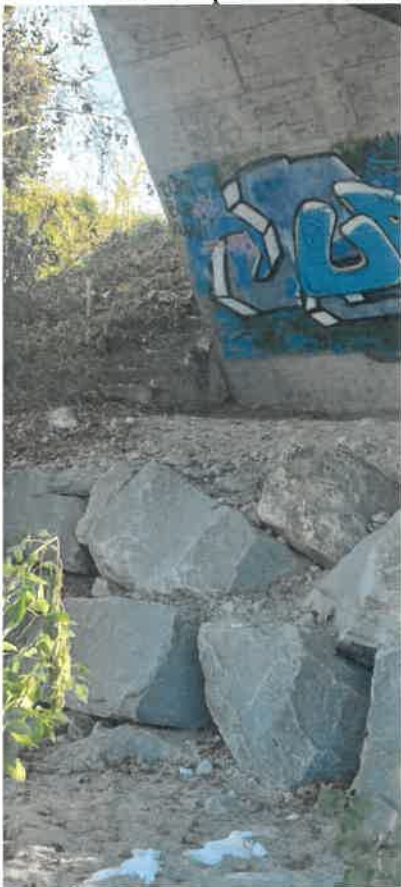
Il passaggio sotto il Ponte di Gorduno