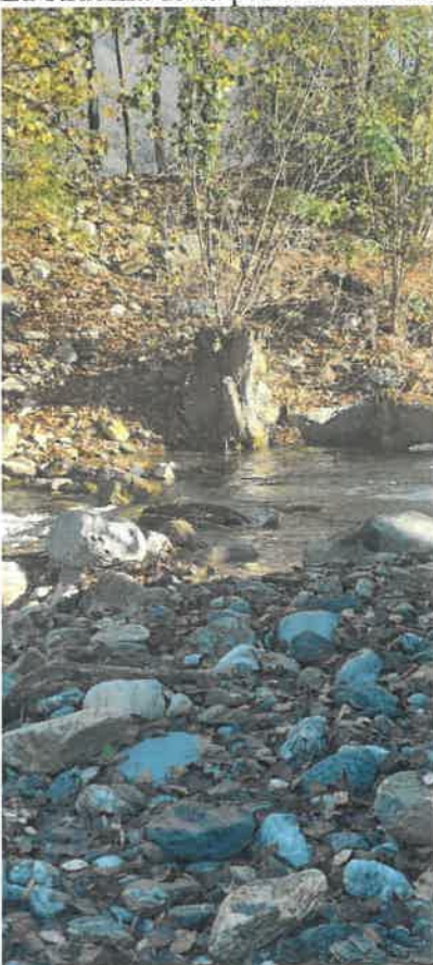
Possibile ubicazione della futura passerella