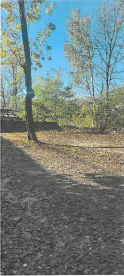
La stradina dalla parte di Arbedo