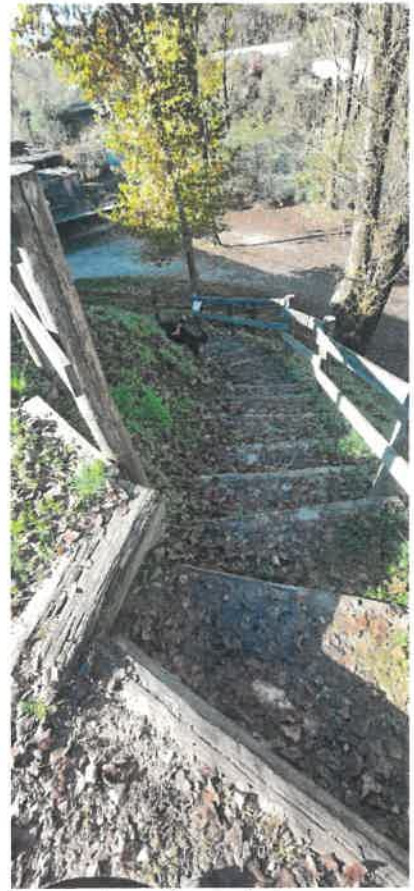
L'attuale scalinata in legno